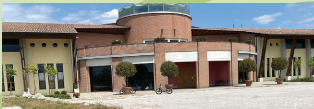
“PERLA DEL GARDA” via Fenil Vecchio nr. 9 – Lonato del Garda (BS)

La Libertas svolge dal 1945 (anno della sua costituzione) una mission di alto profilo valoriale per l'educazione e la formazione dei giovani, per la prevenzione e la salute della terza età, per l'inclusione sociale dei disabili, con una particolare attenzione verso l'integrazione delle minoranze etniche e confessionali, verso la tutela delle figure più reiette e vulnerabili, verso la promozione umana e l'assistenza psico-pedagogica nell'area del disagio minorile. Al centro dell'azione Libertas lo „sport per tutti” sempre più interconnesso con l'ambiente, la cultura, le politiche sociali ed il benessere psico-fisico. La Libertas ritiene che una costante attività motoria possa svolgere un ruolo salutista al fine di prevenire patologie sociali in allarmante espansione (sedentarietà senile, diabete giovanile, obesità infantile, ecc.) che gravano pesantemente sul piano sanitario nazionale.